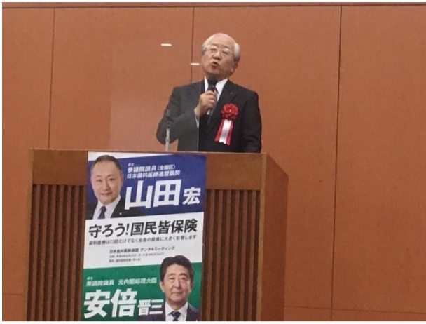
高橋英登 日歯連盟会長