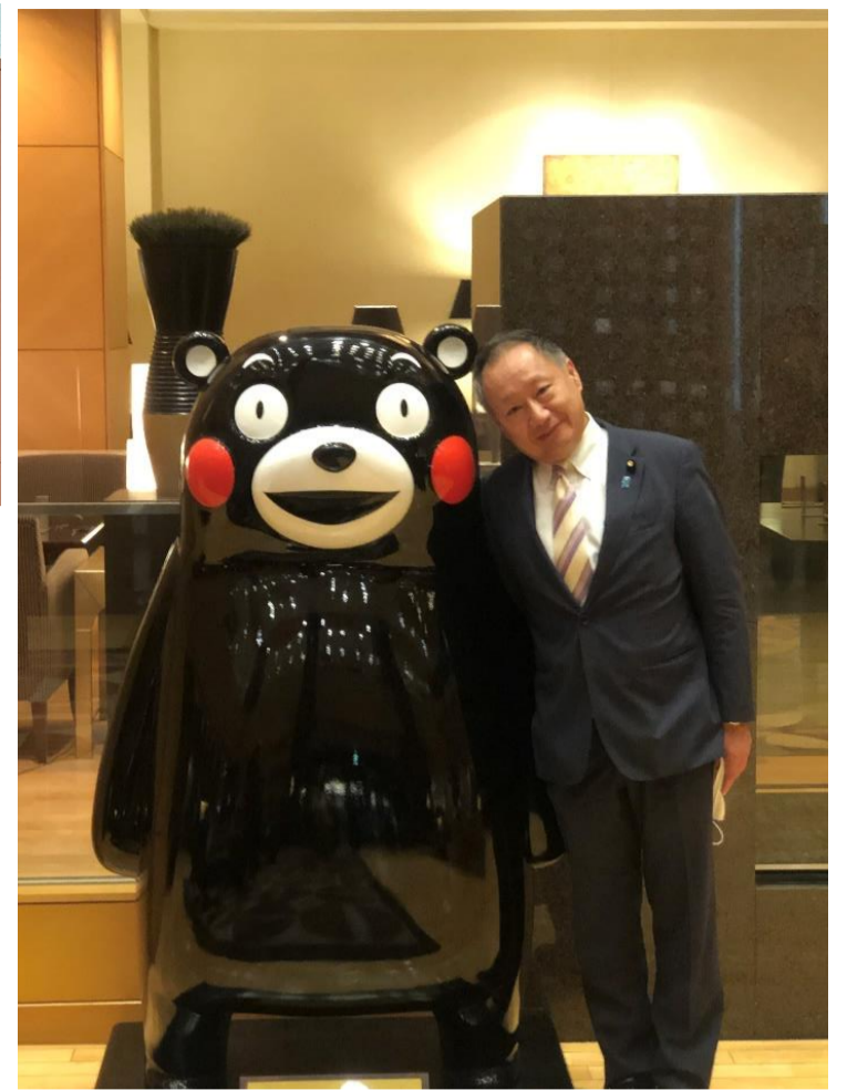
くまモンと一緒にパチリ