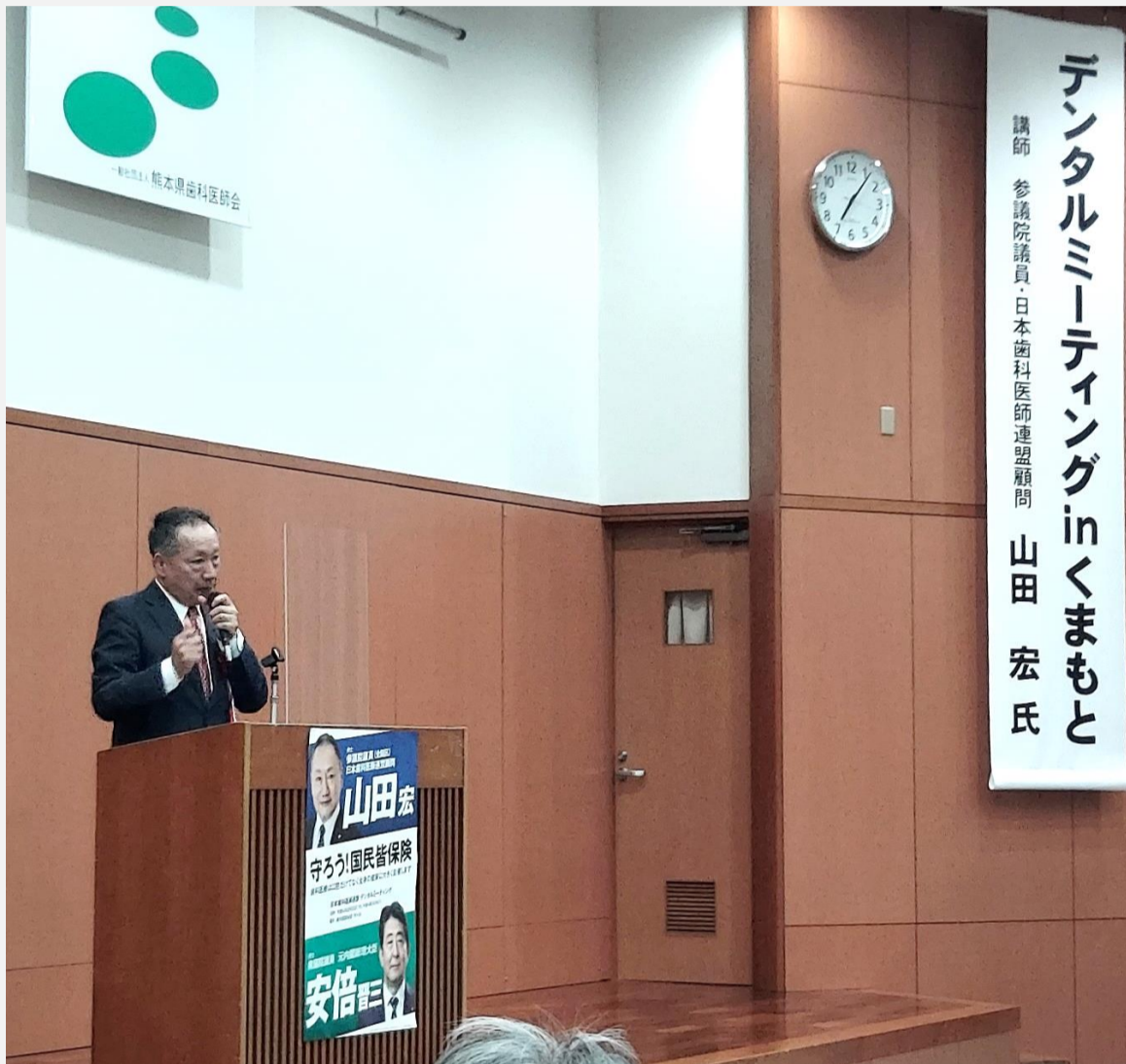
熱い想いを語る 山田 宏 参議院議員