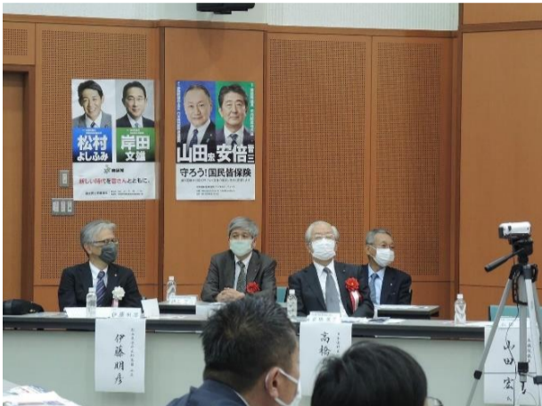
伊藤会長と日歯連盟役員