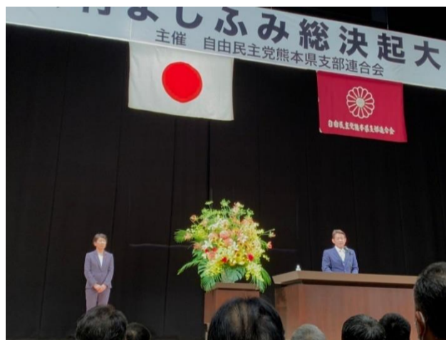
参議院議員 松村 祥史氏