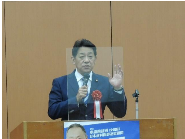
4期目を目指す 松村 祥史 参議院議員